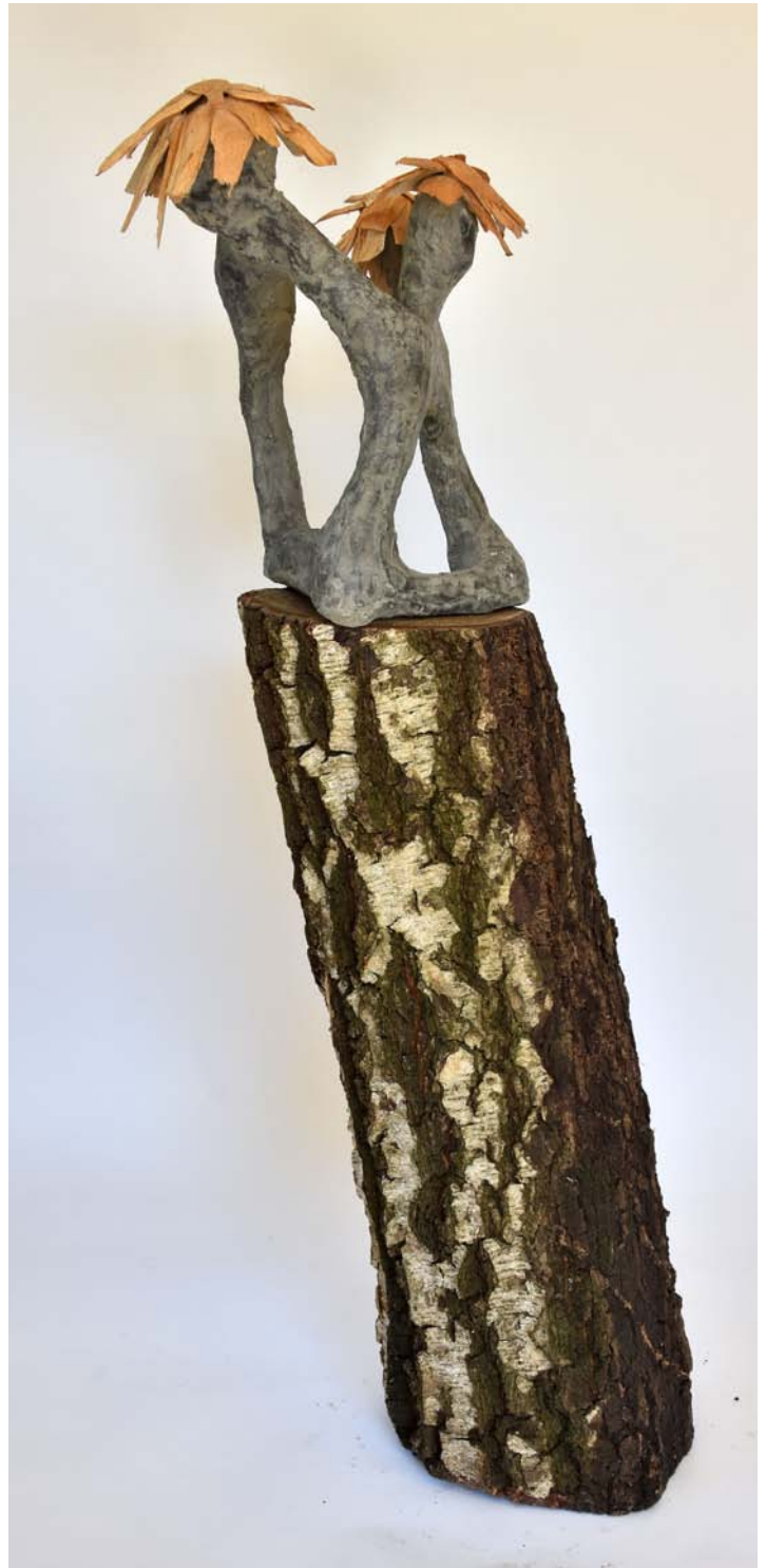
Structuur van kippengaas